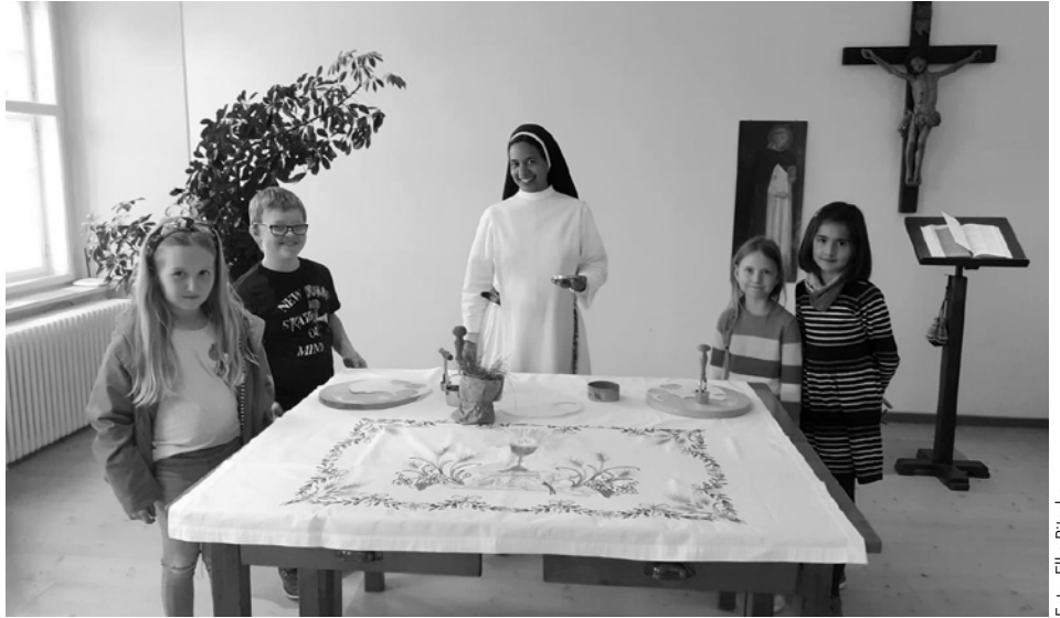
Besuch der Hostienbäckerei