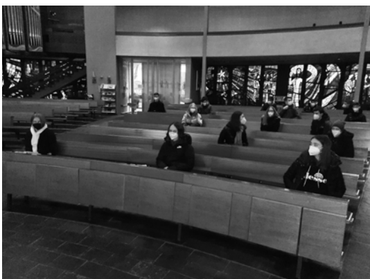
Besuch der Fürobad Abendandacht