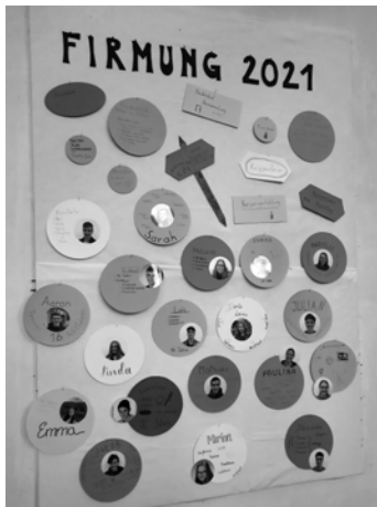
Pinnwand in der Kirche