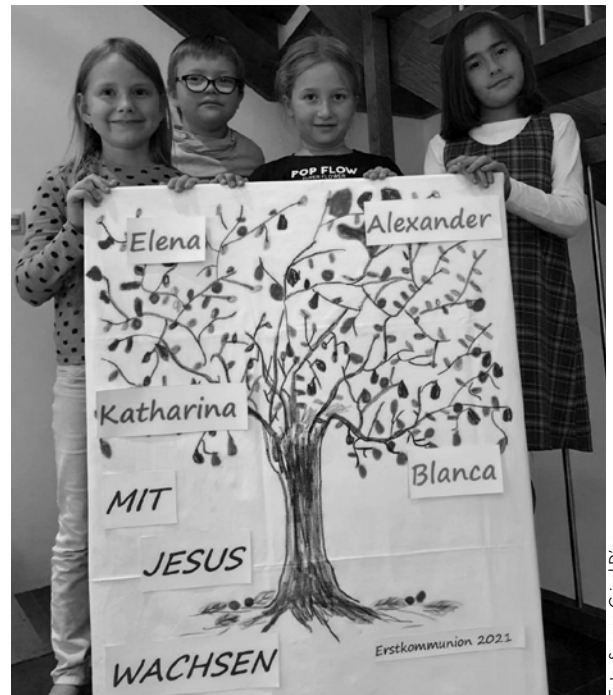
Voller Freude präsentieren die Kinder die selbst gestaltete EK-Wand